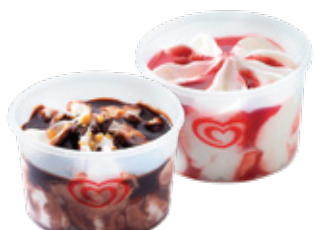
COPOS OLÁ CHOCOLATE OU FRAMBOESA 2.50€