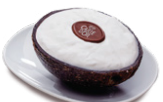
GELADO DE COCO 4.50€