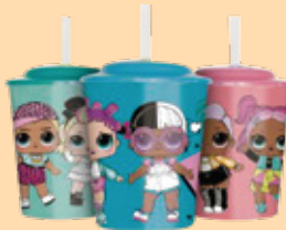
COPO LOL 4.00€