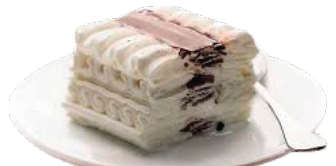
VIENNETA DE BAUNILHA 4.50€