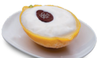
GELADO DE LIMÃO 4.00€