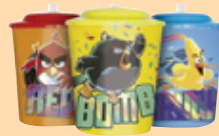
ANGRY BIRDS 4.00€