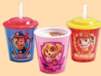
PATRULHA PATA 4.00€