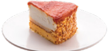
TARTE WHISKY 4.50€