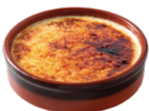
CREME CATALANA 4.50€