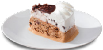
CROCANTE DE CARAMELO 4.50€