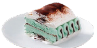
VIENNETA DE MENTA 4.50€